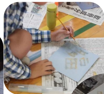
完成した 創作文字