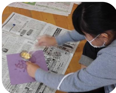
金箔を文字の上に散らす作業