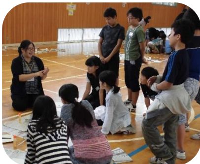
グループごとに説明を聞く

うちの開花宣言で作品を展示した学生さんからは、「地域の妖怪伝説を知っておもしろいと思うことや妖怪伝説のような物語が語り継がれる自分の地域を好きになってほしい。」と話をお聞きしました。