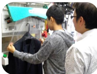
浜倉クリーニング店