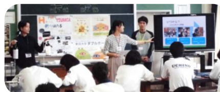
新潟大学 Wホーム (Hホーム) の皆さん