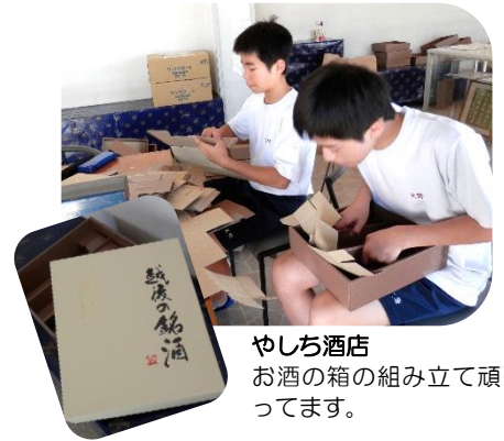
やしち酒店 お酒の箱の組み立て頑張っています。