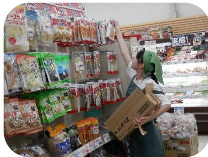
いちまん 商品を補充しています。