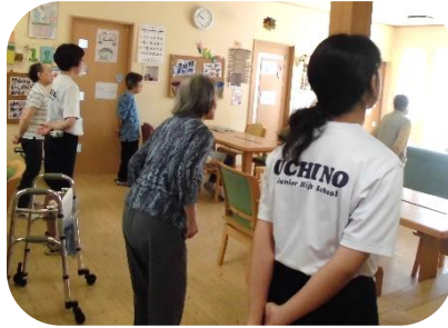
グループホーム うちの 入所者の皆さんと体操。