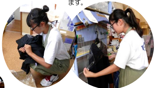
クリーニングのモコ ポケットのゴミを出して、洗濯準備。出来上がった衣類は、ビニール袋をかけて。