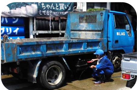
小湊自動車 車の汚れをブラシで落として、洗います。