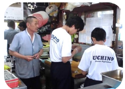
肉正 豚の腸に肉を詰めて、ソーセージ作り。