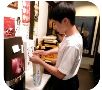
灌寿司 割り箸は袋に詰めて、片付けます。