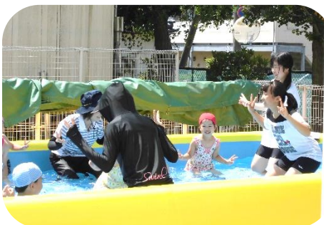
西幼稚園 園児と一緒に音楽に合わせて、エビカニピクスで準備体操。