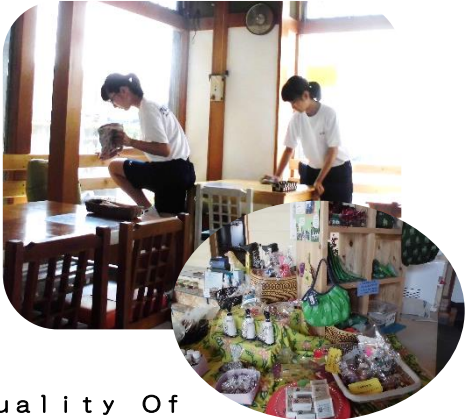
Quality Of Life JETS 窓やテーブルを拭いて開店準備のお手伝い。