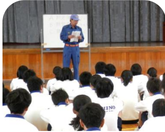
地元の消防団の方から、地域が中学生に期待することについてお話を聞く。