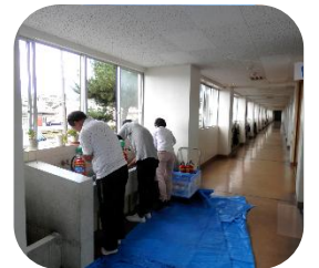
何度も給水に走るボランティアの方々。感謝です。