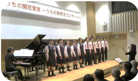
オープンにふさわしい清々しい歌声でした

初めての行事でしたが子どもたちへのかかわり方が素晴らしく、中学生のより成長した姿を見ることが出来ました。嬉しそうに中学生を囲む子どもたちの様子が印象的でした。参加してくれた中学生の皆さん、ありがとうございました。(西内野小・PTA会長 若杉)