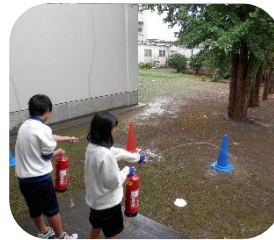
初期消火の大切さ。炎ではなく火元をねらって放水。