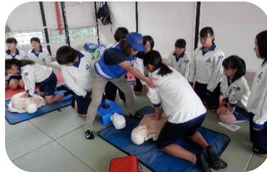
救命救急はチームで！救急車が来るまで交代でがんばる。