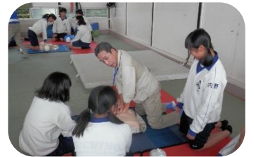
絶え間なく心肺蘇生を続けるのは大変！