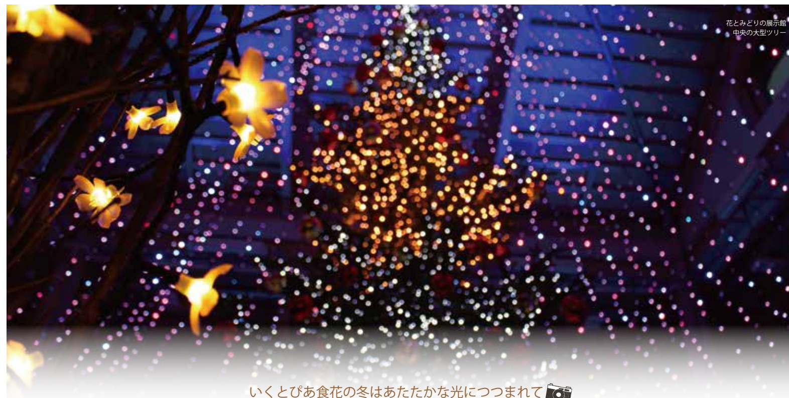
花とみどりの展示館 中央の大型ツリー