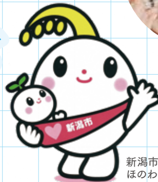
新潟市子育て応援キャラクター ほのわちゃん