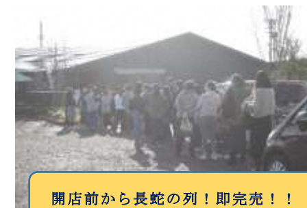
開店前から長蛇の列！即完売！！