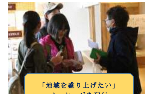
「地域を盛り上げたい」メッセージを配付

私の将来の夢は、いろいろな商品を開発する仕事につくことです。地域の店とのコラボで、地域の人がたくさん買いに来てくれて、商品を開発することは、地域を盛り上げることだと気づいたからです。(6年児童)