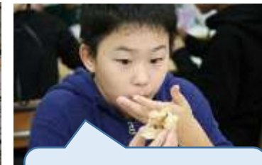
うまっ！予想以上のボリュームとおいしさだ！