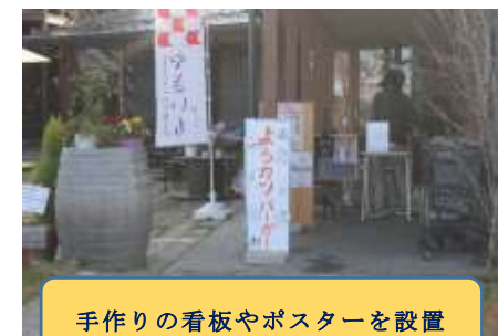
手作りの看板やポスターを設置