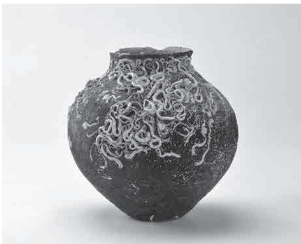
佐渡近海発見の弥生土器