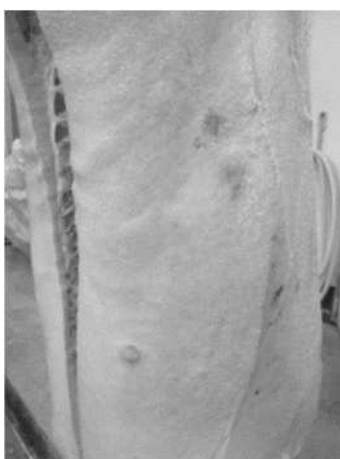
図 2 剥皮後 培養陽性