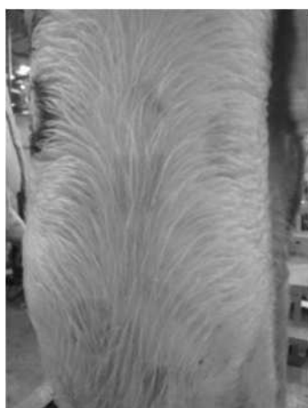
図 1 剥皮前 培養陽性