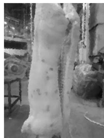
図 3 剥皮後 培養陰性