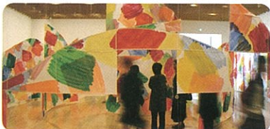
長崎県美術館での個展の様子(2011)