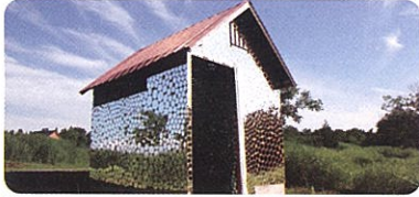
再構築。2006「越後妻有アートトリエンナーレ」出典作品、新潟県十日町市 現在