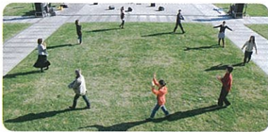
[waodor] (2012) ビデオインスタレーション