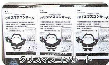
クリスマスコンサート

赤ちゃんを連れただ家族から小中学生そして熟年の皆さんが、年末のこの演奏会を楽しみにして頂いている様子で、年々