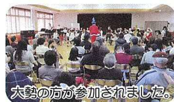
大勢の方が参加されました。

多くなり、去年は百人を超える事となり、会場が狭く感じられてしまいました。嬉しい事です。リルトの皆さんには、雰囲気大切に演奏に気配りして頂くと共に演奏の合間に、曲の説明が丁寧に入り其々の楽器解説が、判り易く有りクリスマスらしい衣装に着替えての演奏、そしてお菓子を配ったりして、決してお子さんにも飽きさせない。そんなこんなで会場の皆さんとの距離感も近く感じて貰えたようで、手拍子が入ったりする、ほんの一時間程のコンサートです。