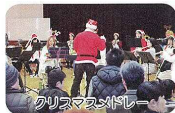
クリスマスメドレー