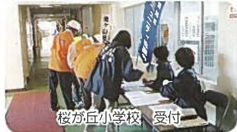
桜が丘小学校 受付