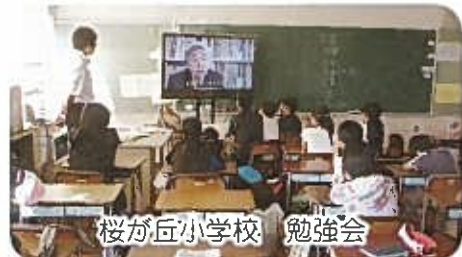
桜が丘小学校 勉強会