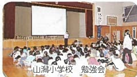
山潟小学校 勉強会