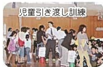
児童引き渡し訓練