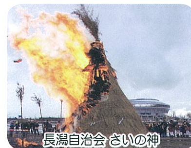
長潟自治会 さいの神

「さいの神」が一月八日、長潟・姥ヶ山地域で行われました。参加した人達は、めめ焼等を楽しみながら、無病、息災を祈っていました。