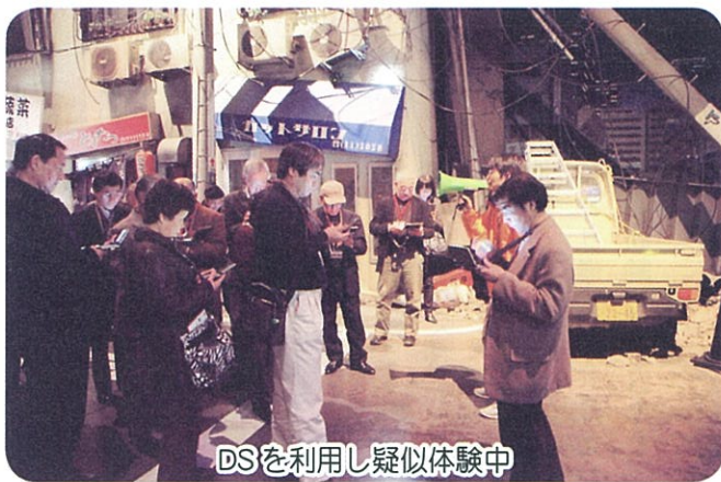
DSを利用し疑似体験中

去る二月十七日防災意識の向上の一環として東京臨海広域防災公園内の体験学習施設「そなエリア東京」へコミ協役員自治会役員（防災担当）そして新潟市中央区の職員等総勢二十九名が参加しました。 当日は、大雪に悩ませられながらも無事視察研修を行う事が出来ました。 防災体験学習施設「そなエリア東京（国の施設）」とは、災害時組織的な救助活動が行われ