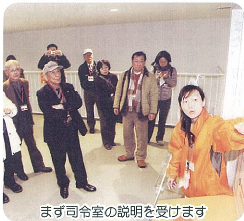
まず司令室の説明を受けます

発行日 平成 24 年 3 月 20 日 発行 山潟地区コミュニティ協議会 総務部会 事務局 山潟会館内 ☎ 025-286-0155 FAX 025-286-0245 新潟市補助事業