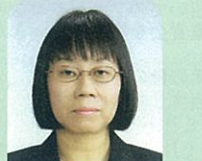
豊嶋桜が丘小地域 教育コーディネーター