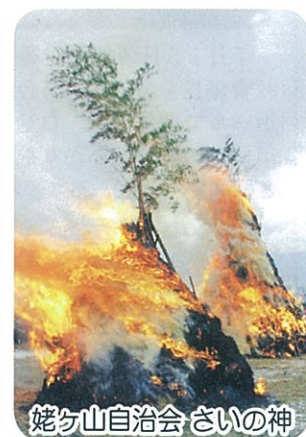
姥ヶ山自治会 さいの神