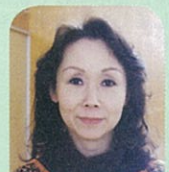
本間山潟小地域 教育コーディネーター

山潟小は3年目、桜が丘小は4年目を終え、学校と地域のかけはしとして活動を進めています。皆さまご協力をお願い致します。（桜）