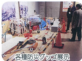
各種防災グッズ展示

今回の視察体験研修では地域の多くの皆さんが参加し、いざという時どのような行動し対応するかを学びました。 こうした体験をした人達のネットワークの広がりが地域の防災力のアップと防災意識の向上に繋がればと思っています。 普段は何げない箇所でも震災時には危険な箇所が変わる事があるということも今回知ることができました。 できれば、これからも多くの人達に体験してもらえれば幸いです。