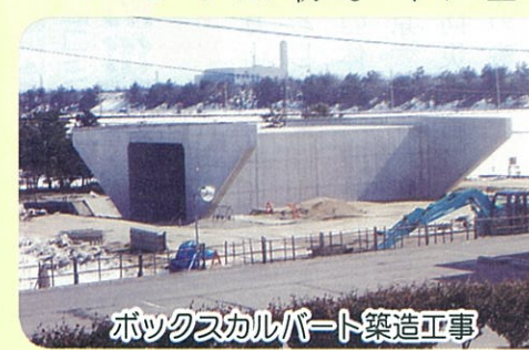
ボックスカルバート築造工事

し、無理な車線変更・割り込みによる交通事故が多発している状況です。救急車等の緊急車両の運行に支障をきたすこともあります。姥ヶ山IC改良事業は国土交通省で平成二十一年度に着手し現在は用地買収及び九月より一部工事を進めています。また、市道弁天線からICに接続する市道嘉瀬蔵岡線は新潟市で四車線化事業を行い、渋滞緩和と歩道幅が確保され、今より安全に歩行することができるようになります。二十三年度は地盤改良工事とボックスカルバートを築造する工事が行われており、今後とも用地買収と改良工事を進める予定となっています。