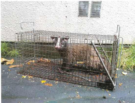
捕獲されたハクビシン

令和3年にも米山第六自治会より話があり、4匹の駆除が行われたと「むらさき16号」に掲載されています。今年も2区（サンライフ米山）付近でハクビシン出沒を確認される。3月～5月に8回、1～3匹が確認されました。3匹のグループと思われる。米山第六自治会5月末に、ハクビシン駆除を決定する。6月7日ハクビシン駆除カゴを設置。6月9日ハクビシン捕獲される。今年も4匹駆除しました。