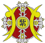
紫竹山小学校校章

「紫竹山小学校の校章は、チチコグサと2人の子どもをモチーフにしています。チチコグサは、紫竹山」という地名のもとになった植物で、昔紫竹山周りに数多く自生していた植物です。2人の子どもは大空に向かって大きく手をのびし、未来に向かって大きく、はばたいていく姿をあらわしています。」と紫竹山小学校開設10周年記念誌にあります。踏まれても刈られてもたくましく生きのびるチチコグサ、その中で大きく羽ばたこうとしている子どもたち、校章の意味する子どもの姿を見た思いでした。