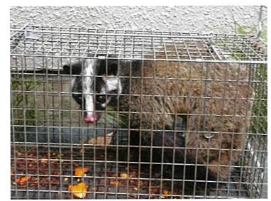
米山6丁目目で捕獲されたハクビシン

東京都内において、アライグマやハクビシンの目撃情報や生活被害等が増加しています。都は、平成25年に「東京都アライグマ・ハクビシン防除実施計画」を策定し、都民の生活被害の軽