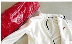
スタッフジャンパーとキャップ