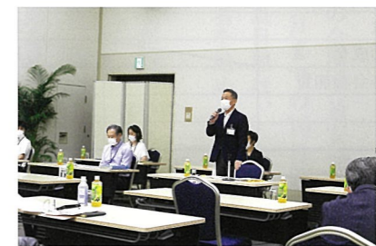
中央区長あいさつ

めていく中で、少しでもいい形に、皆様にとっても、住んで良かったと言われるような駅南地域になるように、我々も進めて参りますので、よろしくお願いたします。本日は短い間ですが、よろしくお願いたします。