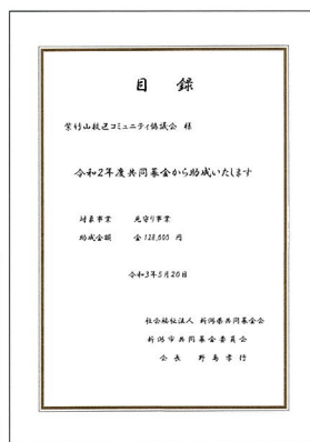
赤い羽根共同募金目録

令和3年度赤い羽根共同募金公募型助成事業に応募して、助成決定しました。助成事業としては、見守り事業におけるフリースジャケット、夏用帽子の購入を行いました。