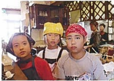
ブルドック 学校町通3 ☎266-2542

ブルドックさんへ ぼくが「すごいなあ」と思ったことは、たくさん料理をたのまれたときに、たくさん料理を一度に作っていたことです。2回目は、やる仕事が終わっていたので、言われる前に仕事できました。