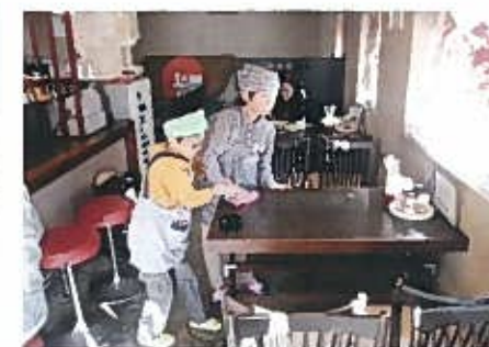
留美園 関屋下川原町1 ☎233-4441