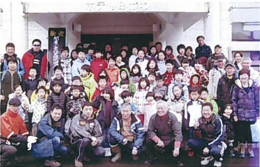
3月1日(日曜)、阿賀町「ホテルみかわ」の玄関前で笑顔の総勢72人

このたびの全4工程にわたる交流活動は、身体の健康増進だけでなく、地域の結びつきに貢献していたと我ながら自負しております。最後にこの事業を