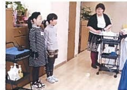
ゆう美容室関屋店 関屋下川原町2 ☎233-0051

2回目の時は、ほうきでうまく髪の毛がとれました。するとお客さんが、「将来のためにもなるから頑張ってるね」と言ってくれました。その時、とてもうれしかったです。