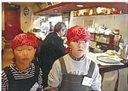
イタリアーノ 関屋下川原町1 ☎231-1981

ご主人は「わたしが話したことはよく理解して、はきはきしていて気持ちよかった」と。