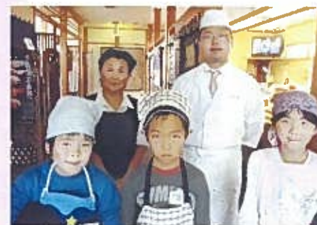
力鮎 関屋田町4 ☎266-4454