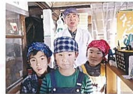
関屋だんご松川屋 関屋下川原町1 ☎266-3561