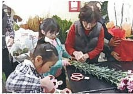
吉田フローリスト 学校町通2 ☎224-2181

小学生の方が中学生よりかはきはきしているようですね。きょうは鉢もののラッピングやカーネーションの水かけなど、手伝ってもらいました。