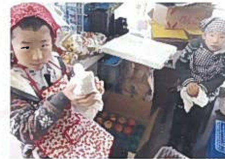
田沢青果店 関屋田町3 ☎231-0106