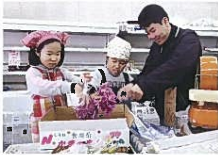
松田八百屋 学校町通3 ☎266-0094

ジャガイモやタマネギの袋詰めと、ハクサイやダイコンを並べることなど、きれいにていねいにやってくれました。時節柄、切り干し用ダイコンの皮むきも手伝ってもらいました。