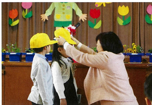
県内新1年生に黄色い帽子を贈呈しています。関屋小学校での贈呈

いのち、健康、尊厳を遵守 支部は、「人間のいのちと健康、尊厳を守る」という使命を果たすため、県内赤十字事業の企画、調整にあたっています。国内災害が頻発する中、日赤は「災害からのいのちをまもる」ために、発災時の救護活動はもとより、平時における防災啓発活動、救命手当の講習普及に力を入れております。 関屋小学校区コミュニティ協議会においても、防災訓練への協力、地域住民及び小学校児童への救命手当講習を実施しております。 現会館は、間もなく築後50年を迎え、老朽化が進んでおります。そのため、「いのちをまもる」活動を「みらいにつなぐ」ことができるよう、現有地に新会館の建設を計画しています。みなさまからも、気軽に足を運んでもらえるような赤十字でありたいと思っておりますので、これからもよろしく願っています。