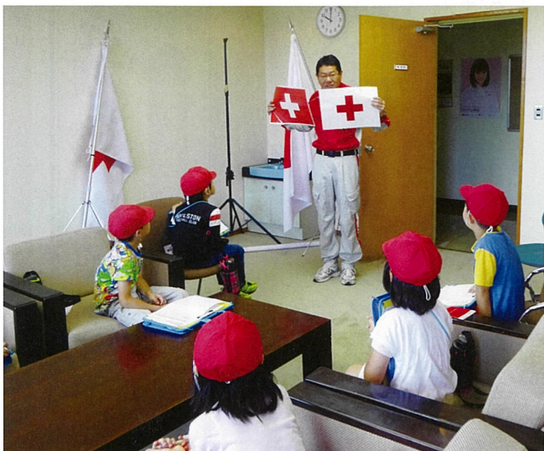
会館には、関屋小学校のみなさんも校外学習に来ています。

新潟にできて今年で133年目 当支部は、明治20年に設立され、今年で133年目を迎えました。当初は、営