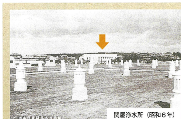
関屋浄水所 (昭和6年)

*関屋浄水所 現在関屋にある本局庁舎の敷地には、事業創設時の明治晩期から昭和中期にかけて、関屋浄水所という今でいう浄水場があり、当時の西新潟と沼垂地区へ水道水を配