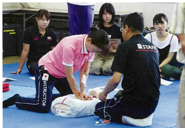
救命手当の講習会も開催しています。(現在は、新型コロナウイルス感染症防止から講習は中止しています)