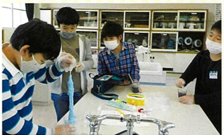
実験クラブ（スライム作り）

12月現在、縦割りの八桜班の活動も再開し、委員会活動やクラブ活動も始めています。当然子供たちは「新しい生活様式」に従い、手洗いや換気等にも留意し学校生活を楽しんでいきます。学校としても子供たちの楽しさにしている活動や行事を大切にしたいと考えています。この半年間で、子供たちは「がまん」することを学びました。今まで当たり前でできていたことが、実は当たり前ではなかったというところにも気づきました。これらの経験は、これからの生活の中できっと生かされるものと思っています。今後も、子供たちの明るい未来のために、学校と地域の皆様及び保護者の皆様とが手を携えて歩んでまいりましょう。