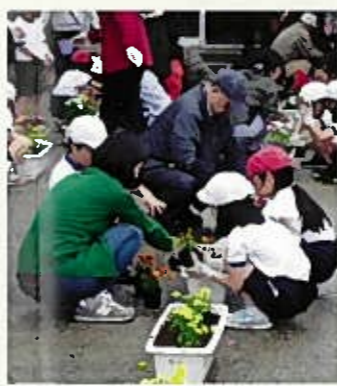
子どもと一緒に植え込み作業

閏屋小学校の花壇では、地域教育コーディネーターやPTAと協力して地域住民と保護者による緑化ボランティアを毎年組織してなかよし花壇の植栽や除草を行うほか、春と秋に児童玄関前のプランターに児童と一緒に花苗を植えて環境美化に努めています。平成30年は5月9日から