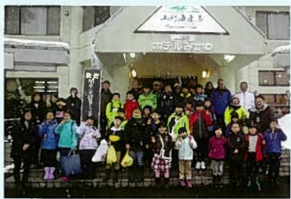
小雪の舞う中、ホテルみかわ玄関前で記念撮影

夕食後の交流会で子どもたちとビンゴやトランプで楽しみ、その後、コミュニティ活動について話し合いを持ちました。