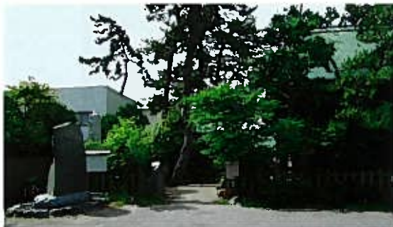
新潟大神社(新潟市西大畑町5195)の会津藩士「殉節之碑」

新潟市内の 戊辰戦争慰霊碑 新潟県内の戊辰戦争は、慶応4(1868)年4月下旬、魚沼方面、柏崎方面で戦火があがりその後長岡攻防戦となり、5月19日(旧暦)長岡城落城となりました。新潟町の攻防戦は7月29日(旧暦)で戦いは終わりました。