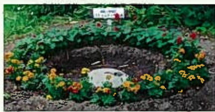
パワーストーン周りの花壇

この数年、花苗を植えることで殺風景になりがちな境内に華やかさが加わって、より親しまれる神社になったと評判が良いです。特に、社務所側通路の右側にある円形花壇の中心には丸い大きな石が鎮座しており、まさに、天神様のパワーストーンです。眺めるだけでもご利益があると思います。