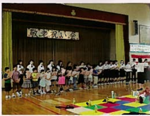
フィナーレに会場の皆さんと一緒に「ふるさと」を歌う、ふれあいスクールの児童たち

今年で7回目の「敬老祝い会」を世代間交流として、9月15日に実施しました。75歳以上106人、お祝いする人110人の計216人の参加があり、自治会長・民生委員児童委員の協力を得て盛大に開催されました。 包括支援センター・中央区健