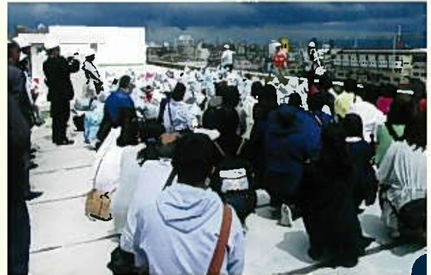
H30年6月16日 全市一斉避難訓練で関屋小屋上に避難集合

一斉の避難訓練に60人の地域・保護者が合同避難訓練に参加して屋上に避難し、その後、体育館にて日赤の講師による、防災教室が開催されました。