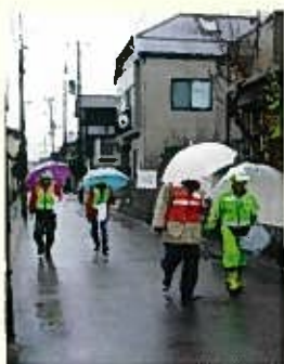
児童下校時間帯に町内をパトロール

平成30年5月に小針小学校区で児童誘拐殺害事件が起きたことから関屋小学校区内では学校職員、防犯協会・コミ協役員、保護者及び警察・教育委員会の関係者で、通学路、公園、空地などの点検・見直しを行いました。当部会は通学路の安全確保と校区内の危険箇所の実態調査を点検検討会議に全面的に協力し、平成31年2月に「関屋小学校安全マップ」が各町内会に回覧配布されました。