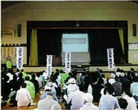
H30.9.9 学校町三番町、関屋田町1丁目、関屋田町2丁目4区合同防災訓練