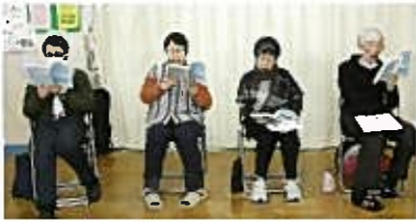
唱歌、抒情歌を歌い気分は青春時代

「参加をお待ちしています」 体操用のヨガマットも歌集も十分用意してあります。皆さんのご