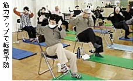
筋力アップで転倒予防

転倒予防に 体しやつきり体操 毎週土曜日の午後、関屋小学校周辺の高齢者が20数人、小学校の集会室に集って、転倒