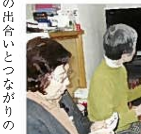
トランプゲームで頭脳は明晰

区社協の助成を受けて、料理実習会（男性は食する）、音楽会、総おどり体操など様々な催しをして、人との出合いとつながりの輪をめざしています。 感謝の心を糧として継続を 今年の6月で満5年の誕生日を迎え、今迄の感謝の心を糧にして続けられたら、うれしいです。