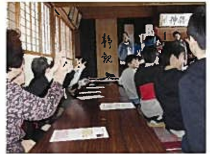
関小6年生とのじゃんけん遊び

毎月1回、第3金曜日に20数名が集まり、お茶を飲みながら、よもやま話に花を吹かせて、楽しいひとときを過ごしていきます。