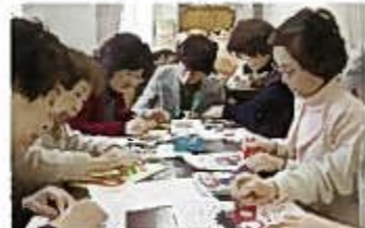
節分の豆まきの準備で、鬼の面づくり