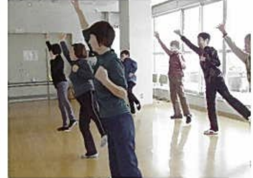
にいがた総おどり体操でシェイプアップ