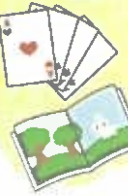
トランプゲームで頭脳は明晰

「町内仲良く、住みなれた家で健康で笑い続けられます様に」と町内会主動で始まったお茶の間です。 毎月1回、素敵な行事を企画 毎月の歌を皆で歌い、ボランティアの協力でも素敵な企画の数々。時にはゲーム大会や手仕事も!! 「町内仲良く、住みなれた家で健康で笑い続けられます様に」と町内会主動で始まったお茶の間です。 多様な行事で出合いの輪の広がりを さらに、より広域の人との交流は、各町内会、地