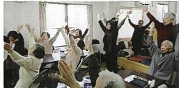
簡単な体操から会は始まります。