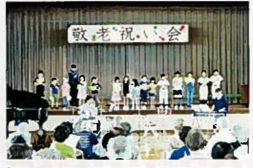
「テル・エトワールとその仲間たち」の伴奏で、明るく元気に合唱するふれあいスクールの子どもたち。

祝敬老祝い会 9月16日 括支援センター関屋・白新の事業説明や中央地域保健福祉センターの「健康についてのお話」を伺いました。また、会場の隅に、「健康相談」や「福祉機器展示」コーナーが設けられてありました。 第2部は楽しく 多彩な演芸... ちよつとお固い話の第1部のあと、ステージに民謡「すみれ舞踊会」5人のみなさんが登場、「花街一代」や「お岩木山」「津軽あいや節」「潮来花嫁」を披露。しなやかなハワーを届けていただきました。