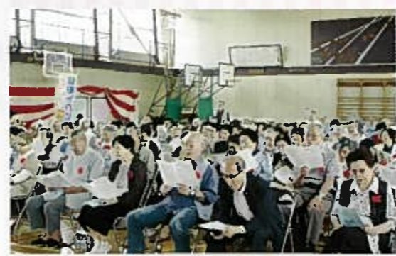
客席のみなさんが歌う「いつでも夢を」が会場に響き渡る。

次は「テル・エトワールとその仲間たち」の4人が登場。ピアノ、フルート、オカリナ、ドラム、パーカッションの演奏が会場いっぱい響きわたる。客席のみなさんといっしょに「砂山」「いつでも夢を」2曲を楽しく歌い、それから、秋の童謡メドレー「月の沙漠」「青春の輝き」など8曲の演奏と楽器の紹介を楽しみました。 最後の曲が終わると盛大な拍手とアンコールの音が湧き上がり、それに応えて「東京ブギウギ」をお聞かせいただきました。 高齢者とのふれあい... 待ちかねていたふれあいスクールの子どもたち15人がステージに整列、「テル・エトワールとその仲間たち」の演奏で、