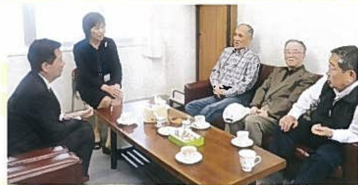
去年5月、校長室カフェオープンの日、その日のひととき

ありがたいご提言 さっそく実行に！ また、別の校長室カフェでの会話です。「校長先生、グラウンドのタイヤ山の側面の色がはげてきたので、ペンキを塗るといいですよ。」と仰ってくださいました。「そうですね。私もそう思っていました。」と会話が弾み、子どもたちや保護者・地域の皆さんと一緒にできる機会をつくって取り組んでいこうという弾みをいただきました。