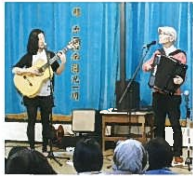
アンコールもやまない、ボサコルデオンのお二人

アコーディオンとギターで会場の皆さんを魅了 コンサートの最後は「ボサコルデオン」のお二人です。お二人とも関屋中学校の卒業生で新潟を拠点に様々なイベントライブで活躍している実力派です。ボサノバやシャンソンの名演奏に会場の皆さんすべてが魅了され、拍手がなかなか止みませんでした。