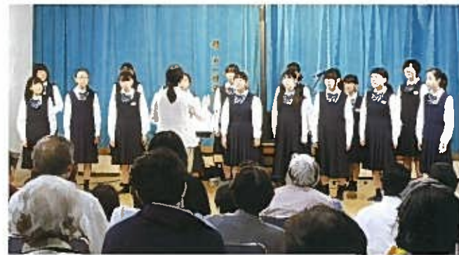
清純な、素晴らしい歌声 関屋中学校合唱部