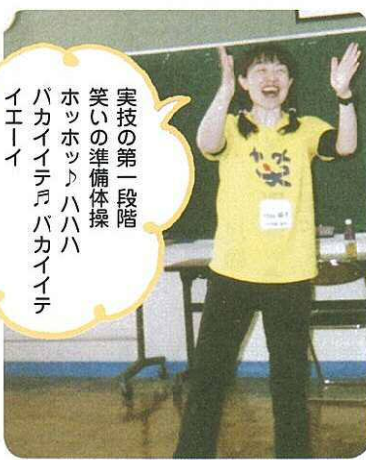
実技の第一段階 笑いの準備体操 ホッホッ ハハハハ バカイイテバカイイテ イエイイ

「笑いヨガ」は挨拶から始まります。笑いヨガはインド人医師のカタリア博士など5人が始めたものから、イ