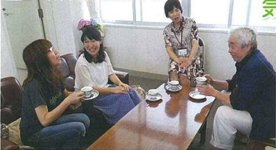
6月20日(月)午前の校長室カフェ