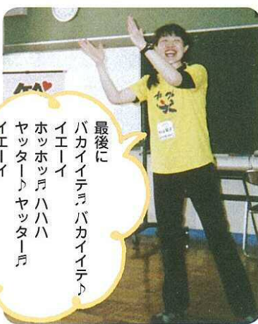
最後に バカイイテバカイイテ イエイイ ホッホッ ハハハハ ヤッター ヤッター イエイイ

参加者の皆さんは、初めは声もよく出ず、つくり笑いもぎこちないものでしたが、段々とホッホッ ハハハハ イエイイの声も大きくなり、笑いも本物となつて、あつという間の楽しい90分間でした。