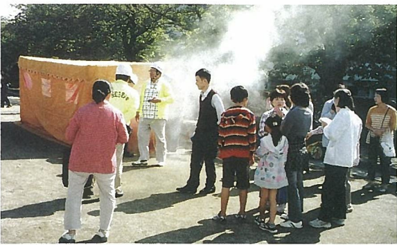
関屋小学校校庭で11:00ころ行われた濃煙体験訓練

など多様な訓練を行いました。これらの訓練は災害の際には必ずや役に立つものと確信いたしております。 しかし、この訓練以外に新潟市から推奨されている訓練が3つほどあります。それは