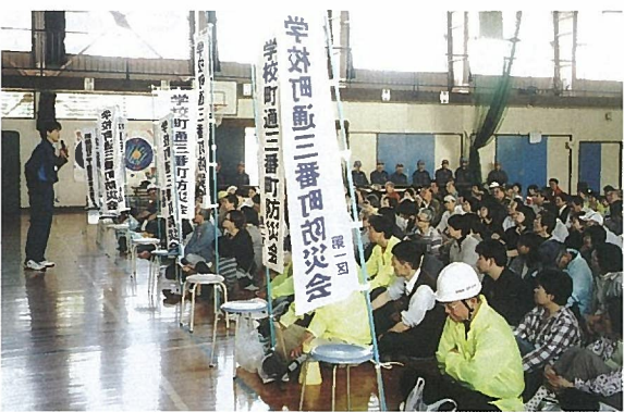
9月27日(日)午前9:30 関屋小学校体育館で、参加者約240人が勢揃いした開会式