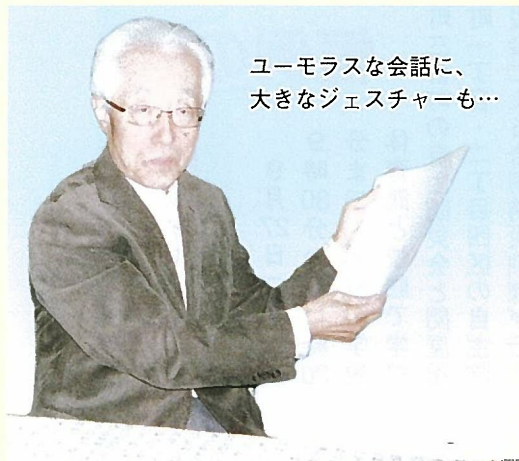
ユーモラスな会話に、大きなジェスチャーも…