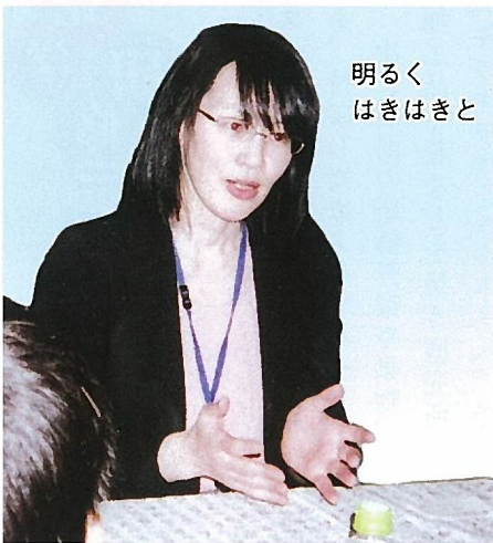
明るくはきはぎと

A みんな大切ですが、「カルシウム」が特に大切です。カルシウムをたくさん摂るには小魚やチーズが有効です。それにバランスよく摂ることが重要です。