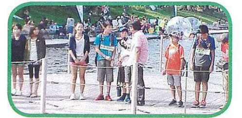
新潟市にある「鳥屋野潟という宝物」を次世代の子どもたちに伝えたい、自然環境の大切さをみんなで共有しよう、というコンセプトで始めました。

9月23日(水・祝)鳥屋野潟公園にて「第10回とやの物語2015」がありました。コミ協は実行団体として、笹口小学校の6年生児童を数人引率しました。ビッグスワンVIPルームでのかるた作り発表、公園内カナルでの学校対抗クイズ大会に参加し、見事優勝しました。