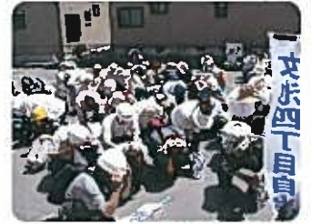
揺れが収まるまで全員が一斉にシェイクアウト

一、13時2分、ラジオ放送、携帯メールで地震発生、大津波警報が発信され全員がその場で頭を守る1分間のシェイクアウトを行う。