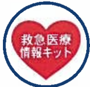
医療情報キットのシールは玄関に。

昨年は80歳以上の方でしたが、今年は「75歳以上のひとり暮らし」及び「75歳以上の高齢者のみで暮らしている世帯」を対象にお伺いします。色々なお話を、お聞きできると嬉しく思います。