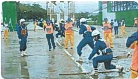
消防操法大会に参加 小型ポンプの部

是非とも、女池校区に居住または、勤務されている方で20歳〜55歳までの方の入団をお願いします。