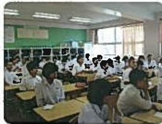
自治会別集会での話し合い

四、15時から生徒が所属する自治会別集会で各自治会長と顔合わせ、地域の活動状況、災害時における中学生に期待すること等を話し合い、16時、訓練を終了した。