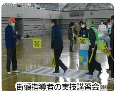
街頭指導者の実技講習会