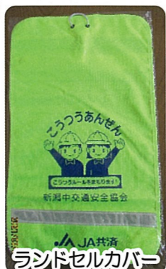
ランドセルカバー