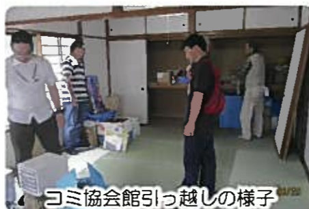
コミ協会館引っ越しの様子