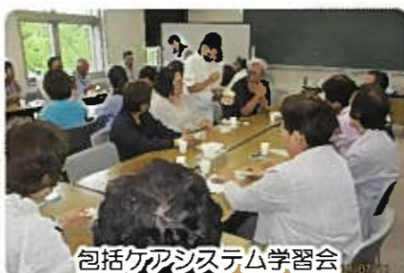
包括ケアシステム学習会