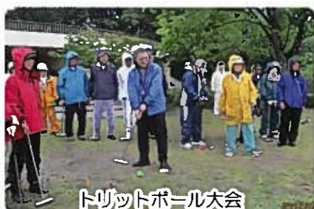
トリットボール大会