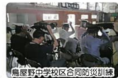
鳥屋野中学校区合同防災訓練