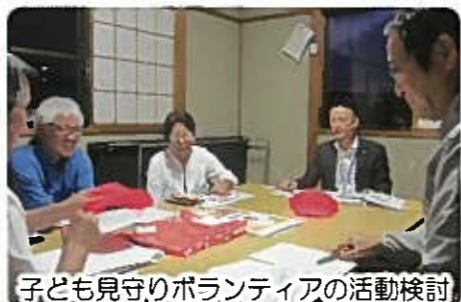
子ども見守りボランティアの活動検討