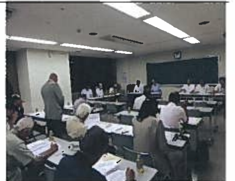
万代地域コミュニティ協議会総会 6月21日