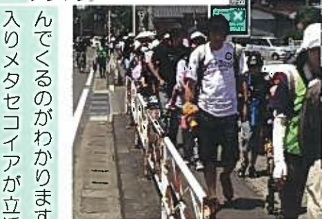
(ウオロク前) 塚塚ショッピングセンター前を通過。出入りする車が多く、注意しながら先へと進む。皆、まだまだ余裕。