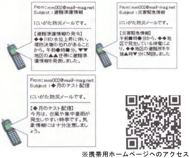
※携帯用ホームページへのアクセス