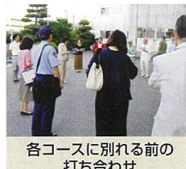
各コースに別れる前の打ち合わせ