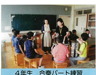
4年生 合奏パート練習