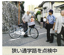
狭い通学路を点検中

7月及び10月に不審者情報の連絡が続いたことから、当コミ協では子ども見守り隊(旧セーフティスタッフ)及び各自治町内会長のメンバーで構成する「緊急連絡網」を作成しました。