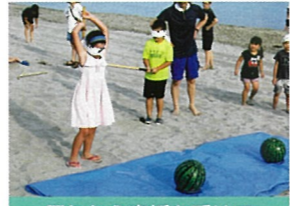
周りから声援を受けて

本年度も4区自治会では、信濃川やすらぎ堤緑地帯のチューリップの植栽に参加しました。平成26年度からこの事業に参加して今年で5回目となります。 この植栽は緑地周辺の小・中学校及び自治町内会の皆さんの協力を得て毎年行っています。