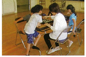
オセロゲームに夢中です

「たつまキッズ(ふれあいスクール)」 有明台ふれあいスクールは、全児童を対象に毎週水曜日と土曜日に開いています。異学年の子ども達が仲良く遊んでいます。参加児童の割合は、市内でも高く好評です。 8月22日(水)に有明台小学校体育館では、卓球、バドミントン、ドッジボールを、プレイルームでは積み木、ゲームなどで夏休みの午前中を利用して児童(38人)とともに民生委員・児童委員、ふれあいスクールの指導員の方々と一緒に活動を見守りました。