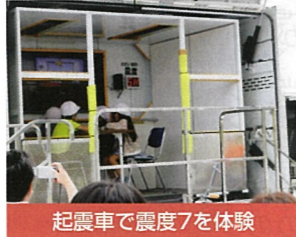
起震車で震度7を体験

(2) 地域住民と児童の合同訓練 各自治町内会単位で各津波避難ビルに避難した後、防災訓練会場の有明台小学校体育館へ集合しました。今から54年前の新潟地震発生時刻の午後1時2分に日本海でマグニチュード7.5の大地震が発生した想定で