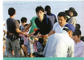
網を引く手には力がいります

五十嵐 夏休み 親子で地引網 7月22日 異常な高温のなかでの地引網でした。結果は、70cmの鱸1匹のほか、鮎(このしろ)2箱の大漁で、網を引く手に入りました。獲れた魚は味噌汁や唐揚げにして、残りは参加者のジャンケン大会の賞品に充てました。食後は、子供たちのお待ち兼ねのスイカ割りを楽しみました。 今回は、海水温が上昇して「腸炎」ブリスト園」による食中毒が心配されたため、刺身等の提供が出来なかったことから、参加者から残念の声が聞かれました。