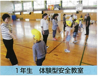
1年生 体験型安全教室