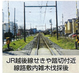
JR越後線せきや踏切付近線路敷内雑木伐採後

当コミ協が新潟県コミュニティ協議会連絡会を通じて、平成30年度に地区要望として提出していたJR越後線「せきや踏切」付近の線路敷内の樹木の伐採が実施されました。踏切手前で一旦停止後、左右の確認が容易になりました。