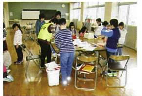
スタッフから指導を受けます

五十嵐 夏休み 親子で地引網 7月22日 異常な高温のなかでの地引網でした。結果は、70cmの鱸1匹のほか、鮎(このしろ)2箱の大漁で、網を引く手に入りました。獲れた魚は味噌汁や唐揚げにして、残りは参加者のジャンケン大会の賞品に充てました。食後は、子供たちのお待ち兼ねのスイカ割りを楽しみました。 今回は、海水温が上昇して「腸炎」ブリスト園」による食中毒が心配されたため、刺身等の提供が出来なかったことから、参加者から残念の声が聞かれました。