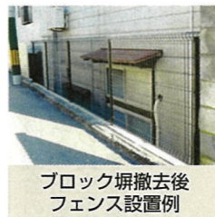
ブロック塀撤去後フェンス設置例

関屋恵町内の通学路脇のブロック塀の一部が撤去され、フェンスが設置されました。これは、市の危険ブロック塀等撤去工事補助制度の活用事例です。なお、市では好評により当該補助金の申し込みを予算に達するまで(先着順)受け付けし、年度内で予算に達しなければ4月からも申請を受け付けます。