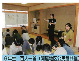
6年生 百人一首 (関屋地区公民館共催)