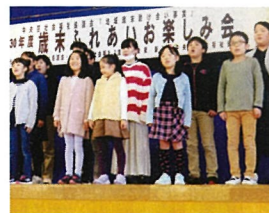
有明台コーラスチーム「タクト」

12月2日(日)有明台小学校を会場に、中央区社協の「地域歳末たすけあい事業」の助成を受けて、歳末ふれあいお楽しみ会が開催されました。 今回は、開始時間を例年より1時間遅らせ10時からオープニングセレモニーとして関屋六階節保存会による新瀧甚句で幕開けとなりました。 アトラクションの部では、新潟第一高等学校吹奏楽部の演奏、フラダンス、民謡と続き、来賓の挨拶後、関屋中学校合唱部のコーラスと続きました。トトリは、有明台小学校のたつまき