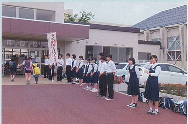
（ 写真上段左：第一小学校贈呈会、写真上段右：第三小学校贈呈会 写真下段左：第一中学校贈呈会、写真下段右：小中合同あいさつ運動の様子 ）