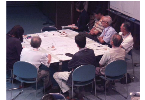
第1回ワークショップの様子

まず、新潟市から公共施設に関する現状について説明があり、その後、7～8名ずつに分かれてグループ討議を行いました。グループ討議では、本ワークショップと検討プロセスの趣旨を把握した上で、地域の現状や公共施設を取り巻く課題について、幅広く意見を交換しました。最後に、各グループでの討議内容を発表しあい、参加者全員で情報を共有し、3時間にわたるワークショップを終えました。