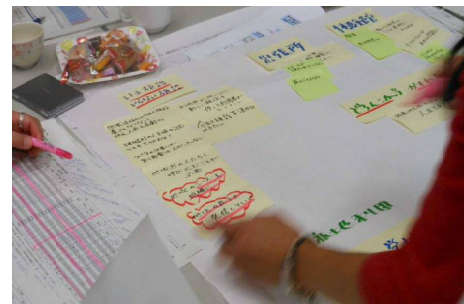
第2回ワークショップの様子