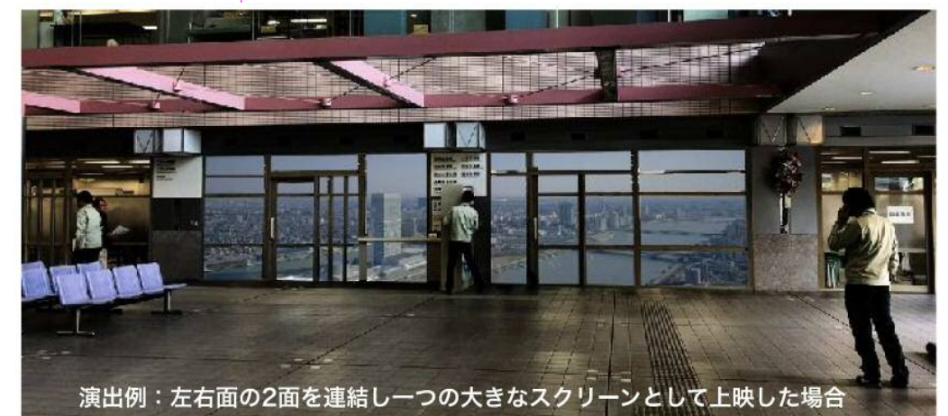
演出例：左右面の2面を連結し一つの大きなスクリーンとして上映した場合