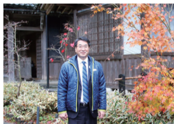
▲中野邸記念館本館前。周辺は石油の世界館、里山ビジターセンター、白玉の滝など見どころが多い