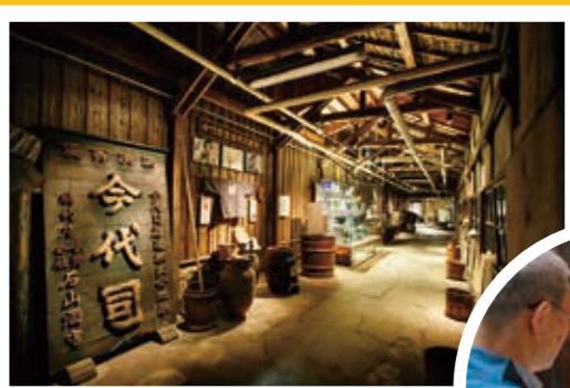
いまよつかさしやぞう