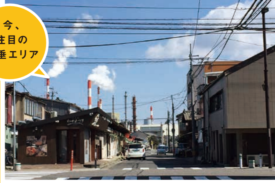
タルヒグラスワークス