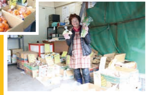
さとうせいかぶつてん