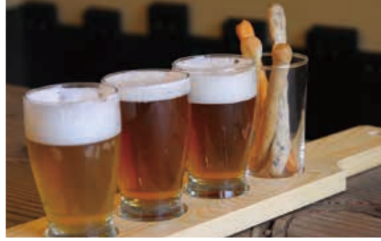
ぬったりビアパブ