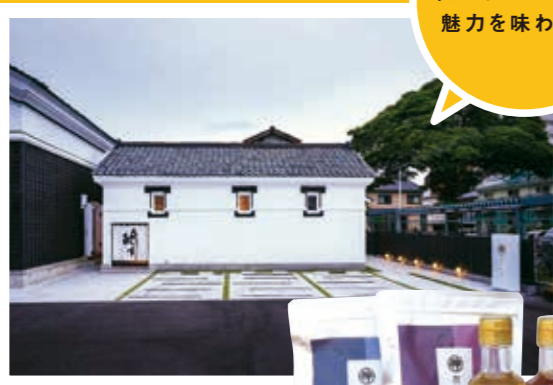
みねむらじょうぞうちよくばいてん