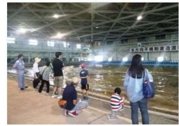
新潟港湾空港技術調査事務所 水理実験場