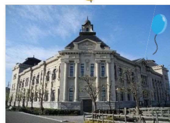
新潟市歴史博物館 みなとぴあ