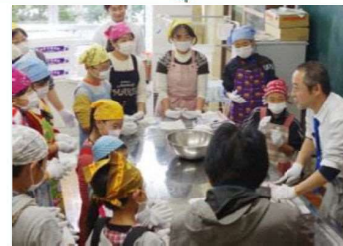
おさかなマイスター