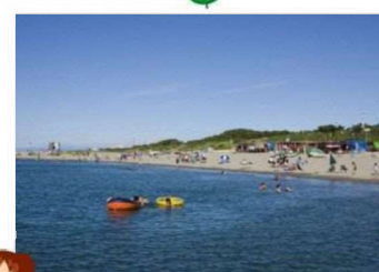
ひよりやま 日和山浜海水浴場