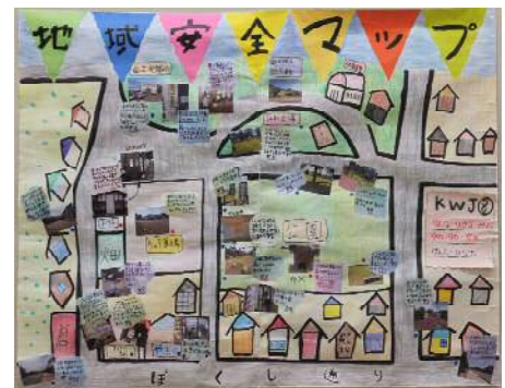
第7回新潟県地域安全マップづくりコンテスト 新潟県知事賞(最優秀賞) 「KWJ®」(塩沢金城わかば児童館)