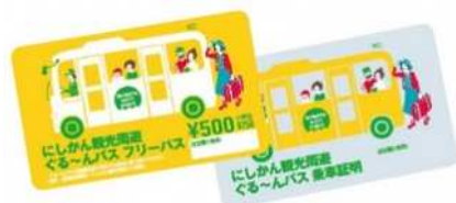
フリーパス（左）と乗車証明（右）