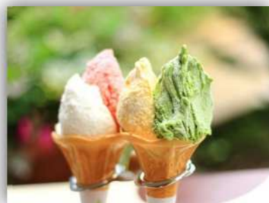
特典一例：ジェラートをシングル からダブルにアップグレード