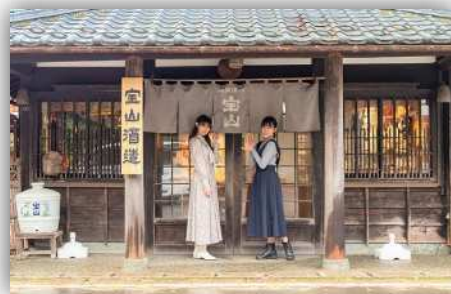
蔵人による酒蔵案内と日本酒試飲 が魅力の笹祝酒造