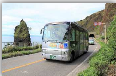
越後七浦シーサイドライン 「立岩」付近を走行するバス