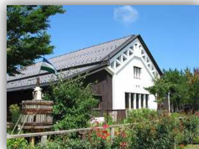
特典一例：新潟ワインコーストで ワイン試飲一杯無料