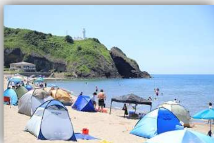
夏の角田浜海水浴場