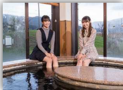
足湯につかってのんびり いわむろや