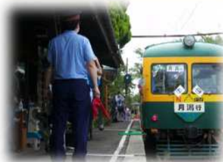
制服姿で手旗を持つスタッフ