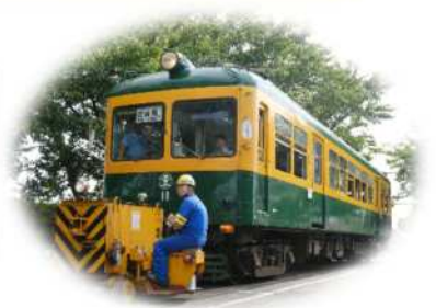
車両移動機「アント」とかぼちゃ電車