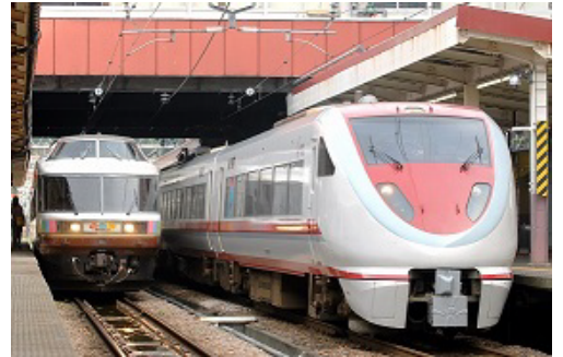
令和4年度応募作品