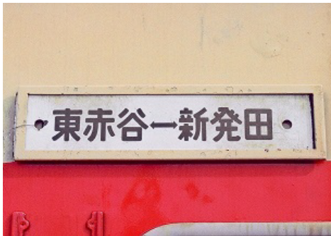
令和4年度応募作品