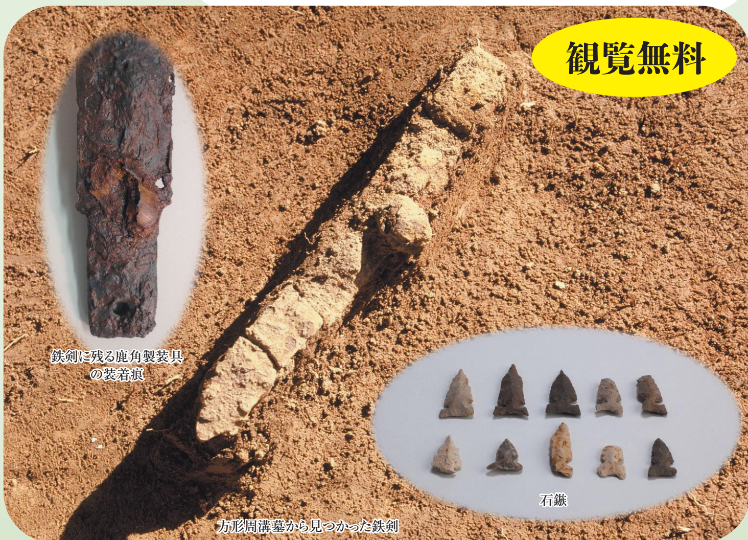
鉄剣に残る鹿角製装具 の装着痕