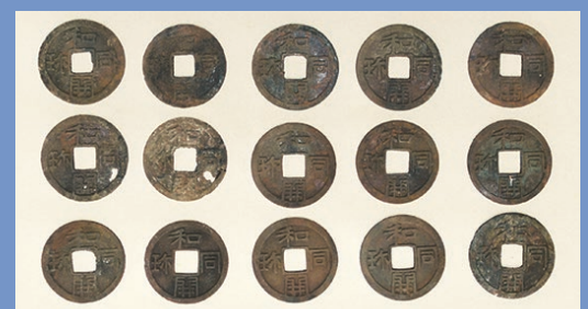
奈良時代のお金 (和同開珎)