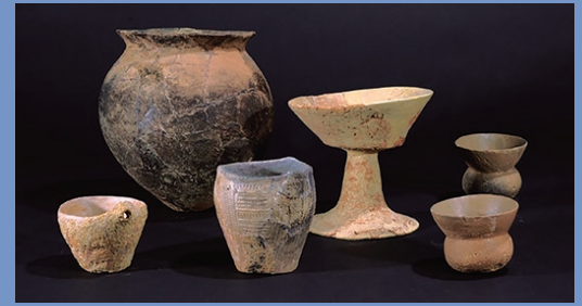
地元の土器と北方民の土器

古墳時代前期の集落跡から出土した、北方民と接触があったことを示す貴重な資料です。