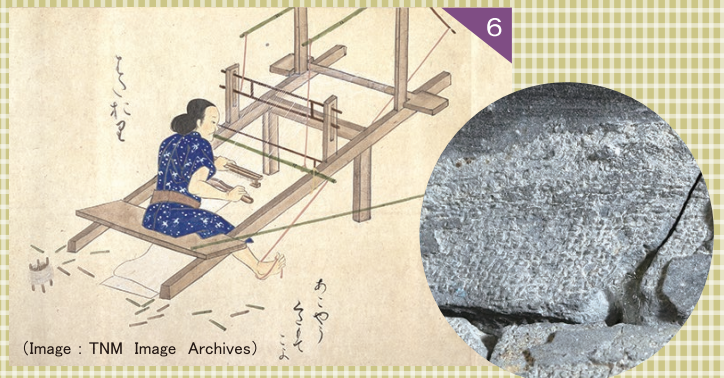
縄文土器に残る布の痕