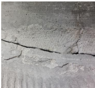
土器に残る布の痕