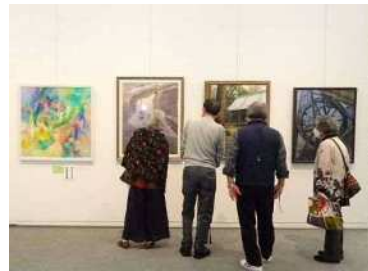
昨年度開催の様子