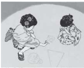
【版画】「祭りの片隅で」生越昭男