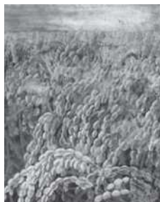
【日本画】「実り」長谷川淳子