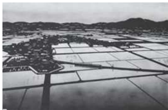
【工芸】「越後平野（夕暮れ）」杉崎新作