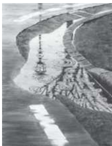
【洋画】「水雨」石川孝司