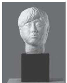
【彫刻】「なつこ」太刀川大翔