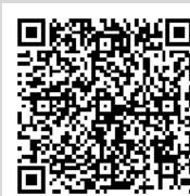
にいがたバス 乗換案内サイト