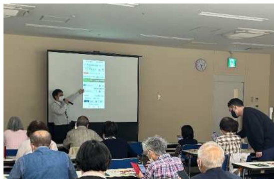
前回スマホ教室実施の様子(令和5年5月)