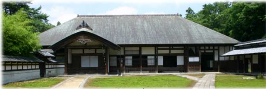
重要文化財旧笹川家住宅

今年初となるこの事業を、多くの方に周知いただき、魅力あふれる笹川邸にご来場いただきたいと考えております。また、園児が製作する過程につきましても併せて取材・広報いただきたくご協力をお願いします。