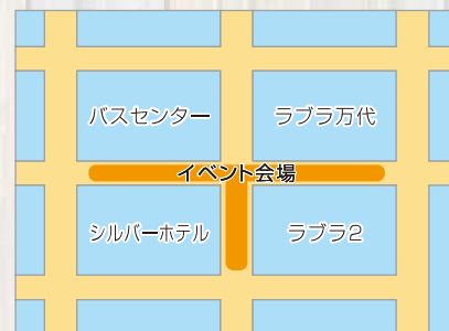
【1小間のイメージ図】

※原則、1者1小間、2日間での出店となります(複数者でのグループ出店の場合は最大2小間まで可)