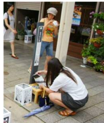
スタンプラリーイメージ