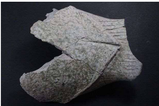
鳥形製品 胴部～尾部