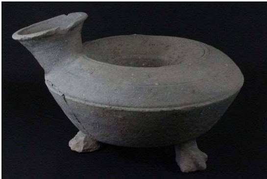
3本の脚が付いた環状瓶