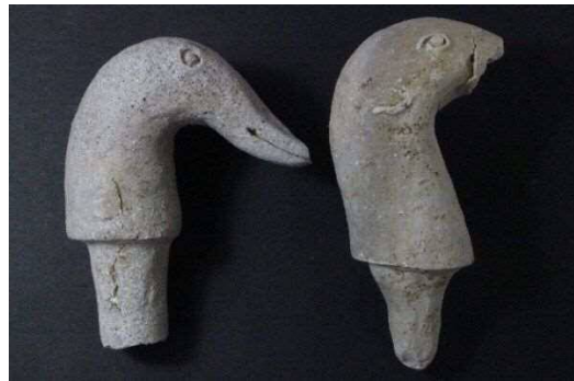
鳥形製品(右)と不明製品(左) 頭部～頸部