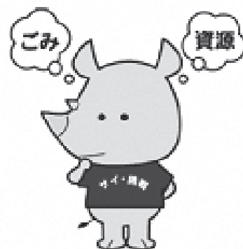
新潟市ごみ減量推進 キャラクター 「サイチョウ」