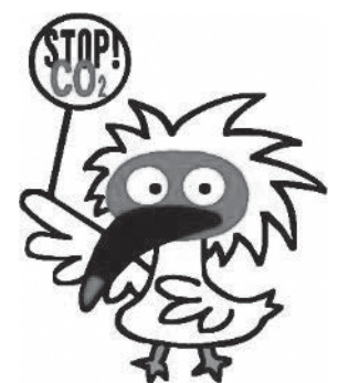
新潟市地球温暖化防止 イメージキャラクター 「とめドキくん」 Character design: Ga2Ga4