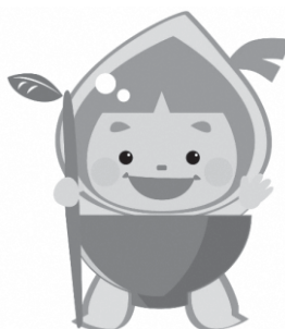
新潟市下水道キャラクター 「水玉ぼうし」