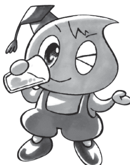
新潟市水道局キャラクター 「水太郎」