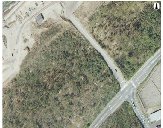
(平成 26 年度)