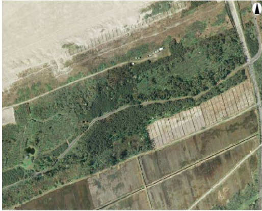
(平成 20 年度)