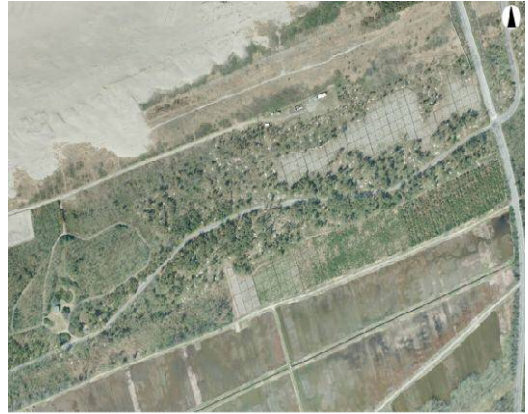
(平成 26 年度)