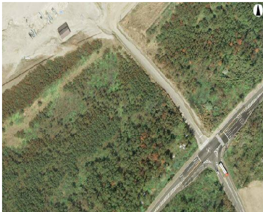
(平成 20 年度)