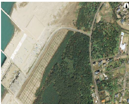
(平成 20 年度)